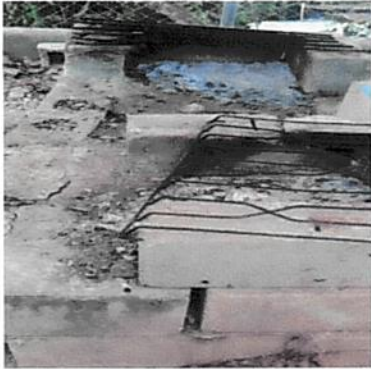
Foto1: Cocina no tiene estufa ni plancha lorena para cocinar.